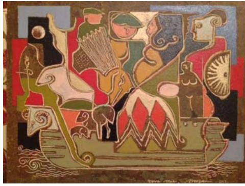
Terre mie. Olio di Megian.